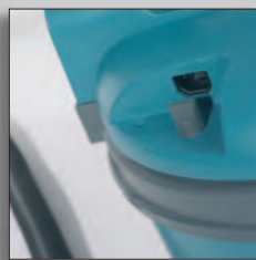
Быстросменяемый сетевой кабель