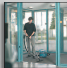
Пылесос в работе