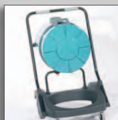
Бак легко опрокидывается для слива