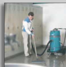
Пылеводосос в работе