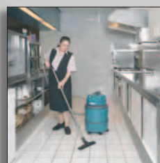
Пылеводосос в работе