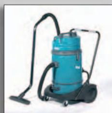
Большая вместимость V14 с тележкой