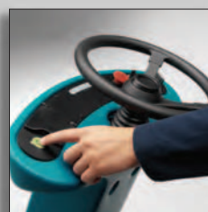
Запуск работы одной кнопкой