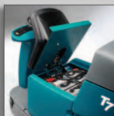
Аккумуляторы с продолжительным циклом работы