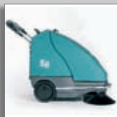
Отбойные колеса на корпусе