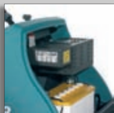
Встроенное зарядное устройство