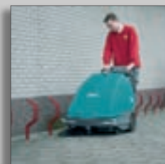
Машина в действии