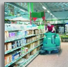
Машина в действии