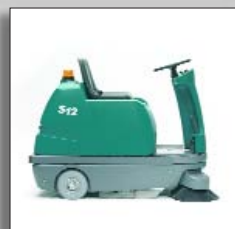
Стандартная боковая щетка