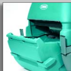
Выдвигающийся мусоросборный бак