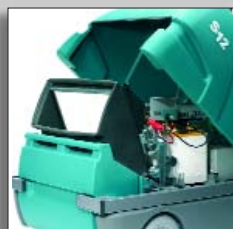
Простота замены фильтра